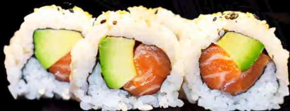
83 SALMÓN y aguacate