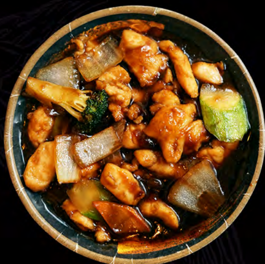
28 POLLO con verduras