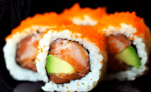
85 CALIFORNIA tobiko