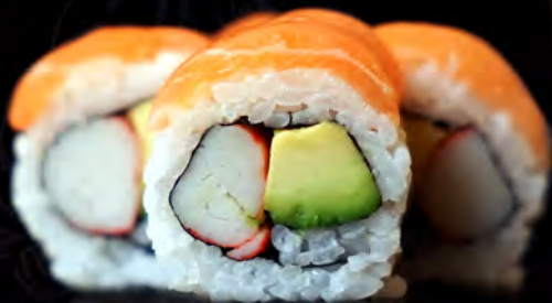
84 CALIFORNIA de salmón