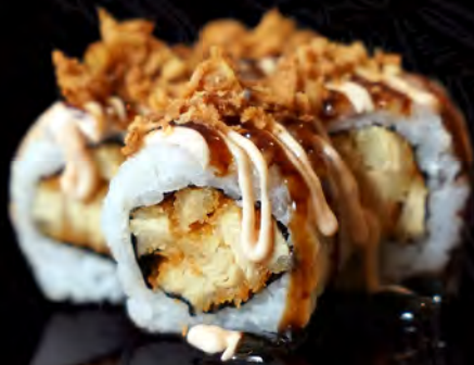
82 CALIFORNIA de pollo kimono