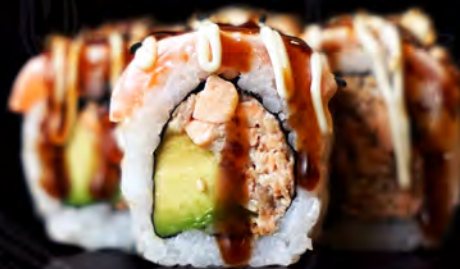
91 SALMÓN cocido, aguacate y philadelphia