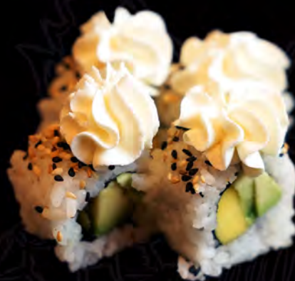
122 CALIFORNIA de aguacate queso philadelphia y mango