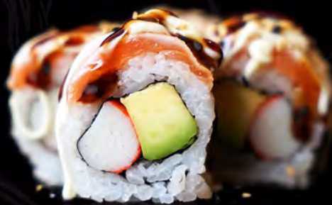
92 CALIFORNIA de salmón flambeado