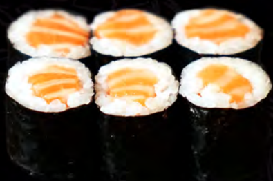
73 SALMÓN 6uni.