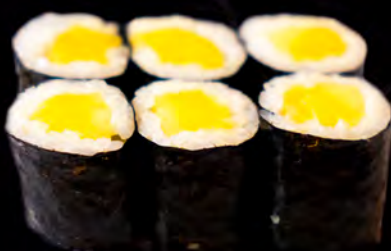
71 MANGO 6uni.