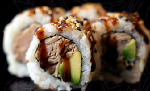
86 BONITO y aguacate