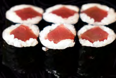
74 ATÚN 6uni.