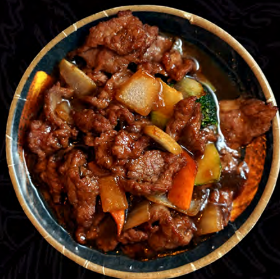
29 TERNERA con verduras