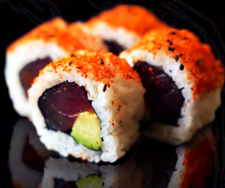
89 CALIFORNIA picante de atún y aguacate