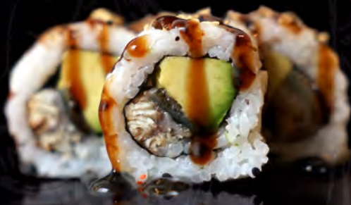
90 ANGUILA y aguacate