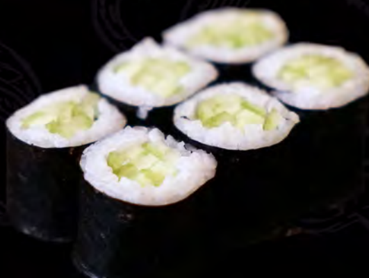
70 PEPINO 6uni.