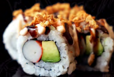
87 CALIFORNIA de aguacate y cangrejo