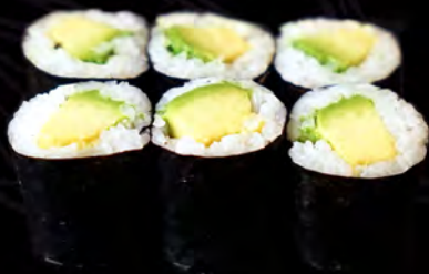
72 AGUACATE 6uni.