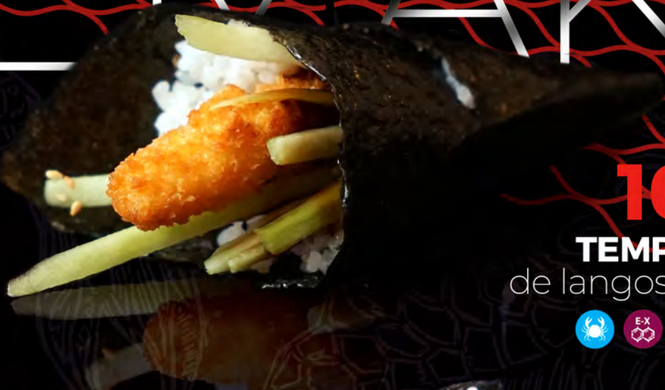
107 TEMPURA de langostinos