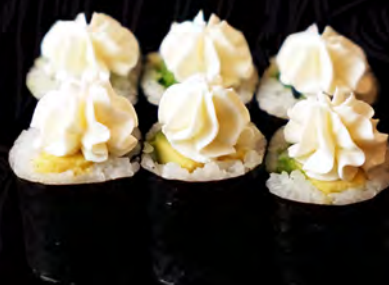
75 AGUACATE y queso 6uni.