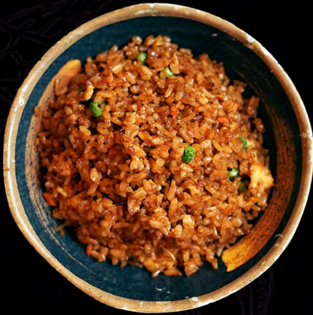
117 YAKIMESHI negro