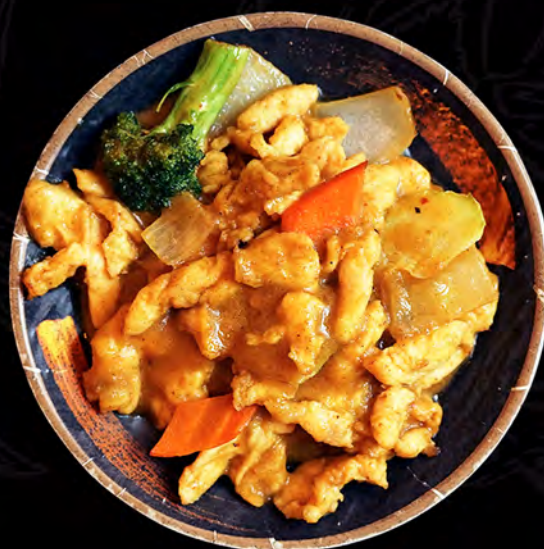
33 RAISU pollo curry