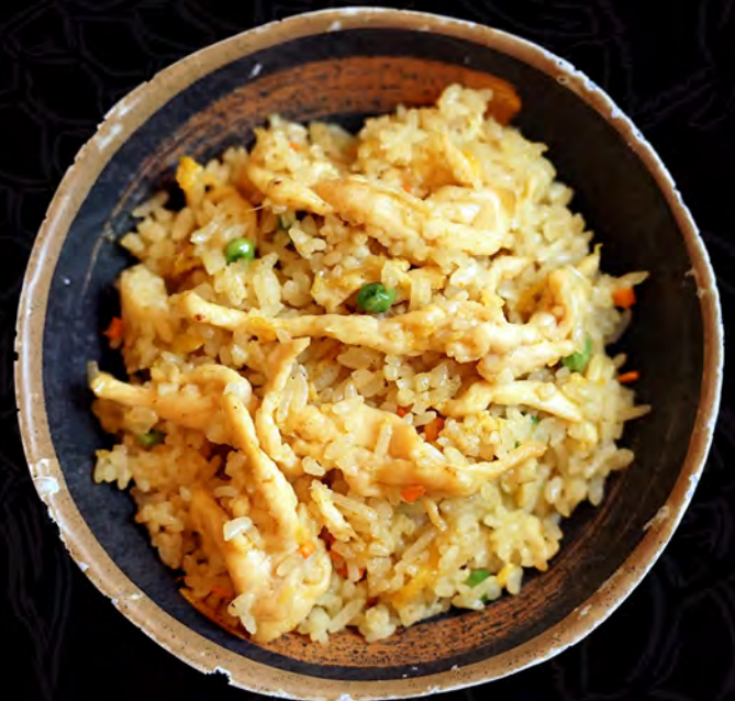
19 YAKIMESHI curry