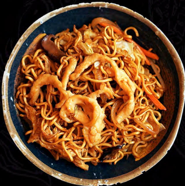
22 YAKISOBA con pollo