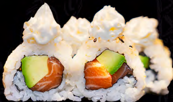
88 QUESO philadelphia 4uni.