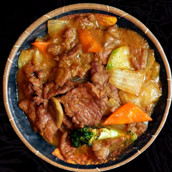
32 RAISU ternera curry